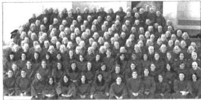
Las hermanas de lessu Communio decidieron vestir hábitos de tela tejana debido a su juventud y a su diferente manera de ejercer la práctica religiosa

Las hermanas de lessu Communio celebrarán mañana la inauguración de su convento con una hora y media de apertura al público y una Eucaristía por la tarde oficiada por el arzobispo Antonio Cañizares.