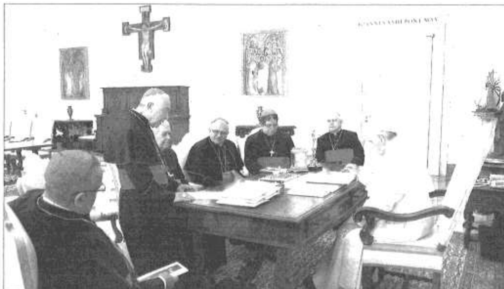
El papa Francisco recibe ayer en el Vaticano a una delegación de la Conferencia Episcopal de Venezuela.