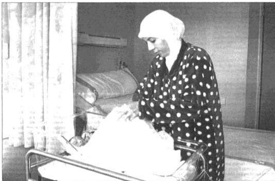
Una mujer oriunda de Nador cuida a su bebé en el hospital de Melilla.

El año 2014 fue el primero en el que el Hospital Comarcal de Melilla atendió más partos de mujeres extranjeras que nacionales. De los 2.757 que hubo, 1.741 correspondieron a mujeres de otro país, la práctica totalidad procedentes de Marruecos, es decir, un 53%. Que las